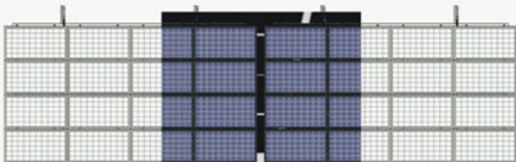
VISTA EN PLANTA.